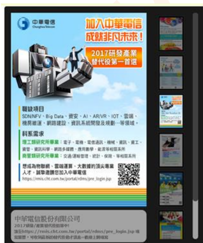
電子廣告輪播參考圖