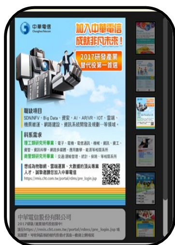
電子廣告輪播參考圖