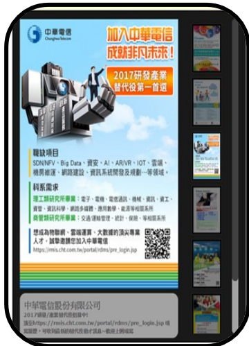
電子廣告輪播參考圖